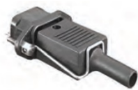
Clip de retención (incluido)