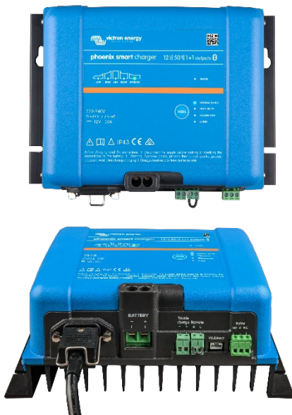
Phoenix Smart 12/50(1+1)

Puede encontrar más información sobre carga adaptativa, en la sección Descargas / Libros blancos de nuestro sitio web.