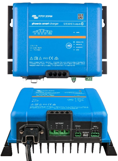
Phoenix Smart 12/50(3)