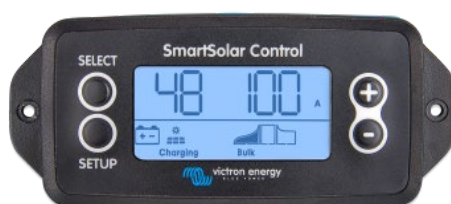
Pantalla conectable SmartSolar

Simplemente retire el protector de goma del enchufe de la parte frontal del controlador y conecte la pantalla.