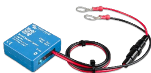
Sensor Bluetooth: Smart Battery Sense