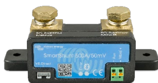
Detección Bluetooth: SmartShunt