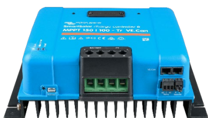
Controlador de carga SmartSolar MPPT 150/100-Tr-VE.Can sin pantalla