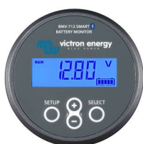
Sensor Bluetooth: Monitor de baterías BMV-712 Smart